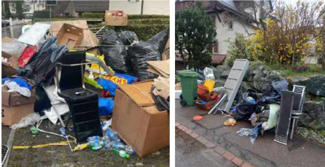
(Bilder Sperrgutabfuhr vom 24. März 2025)

Seit mehreren Jahren bietet die Gemeinde Neerach ihrer Bevölkerung 2-mal jährlich eine kostenlose Sperrgutabfuhr an. Die Daten werden im Abfallkalender sowie im Mitteilungsblatt publiziert und es wird auch erwähnt, welche Gegenstände der Sammlung mitgegeben werden können. Die Sperrgutsammlung vom 24. März 2025 hat leider gezeigt, dass sich viele Einwohner nicht an die Vorgaben halten und versuchen, allerhand Restmüll zu entsorgen.