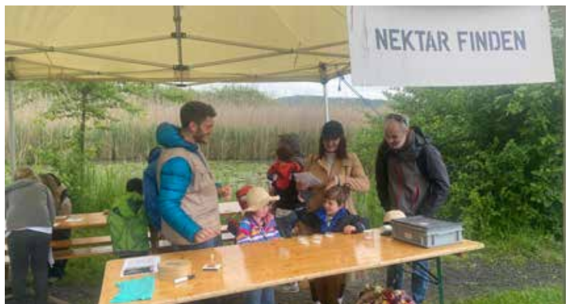
Am Frühlingsfest gibt es Spiel und Spass für Klein und Gross.

Führungen mit angemeldeten Gruppen sind täglich möglich ausser montags (es sind noch einige Termine frei).