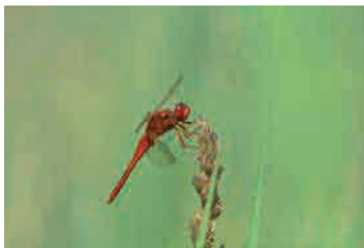
Jetzt sind im Ried viele Insekten zu sehen, hier eine Feuerlibelle.

Einwohnerinnen und Einwohner der Gemeinde Neerach können auf der Gemeindeverwaltung eine kostenlose Jahreskarte beziehen.