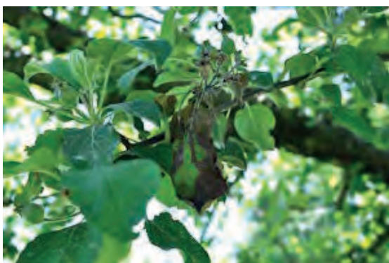
typische Feuerbrandsymptome an Apfel

Obstproduzenten Ihrer Gemeinde sind Ihnen dankbar, wenn Sie mithelfen, den Feuerbrand-Befallsdruck so niedrig wie möglich zu halten. Ab Juni sind die Feuerbrandkontrolleure der Gemeinde unterwegs, um Wirtspflanzen auf Feuerbrand zu kontrollieren.