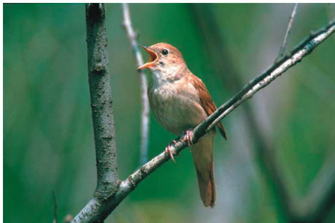
Vogelgesang überall (hier eine schmetternde Nachtigall) – unter kundiger Leitung zu erleben an zwei Anlässen des Naturzentrums. (Foto: BirdLife Schweiz).